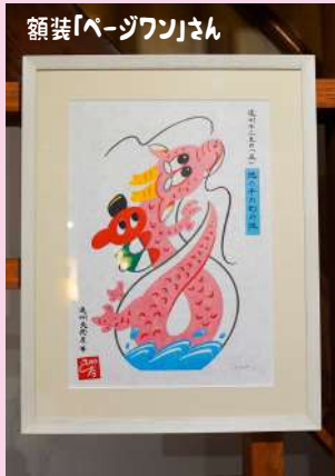
遠州絵「池の平の幻の池」