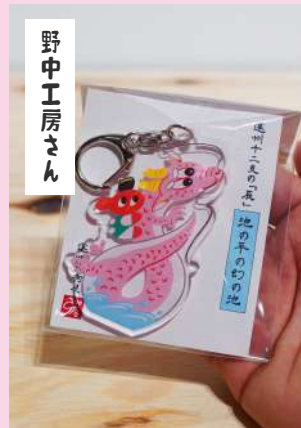
アッキー「池の平の幻の池」