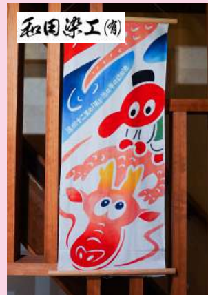
浜松注染そめてめぐい